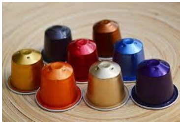
Cápsulas de café (recogida específica en tiendas)