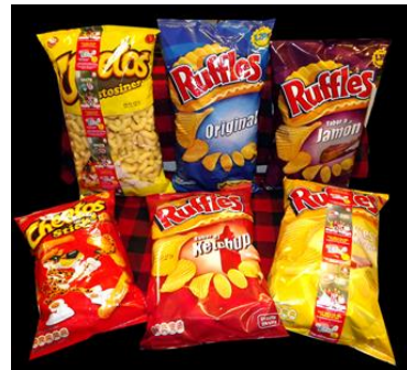
Bolsas para patatas fritas