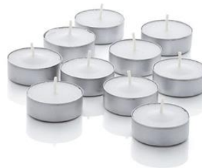
Recipientes para velas