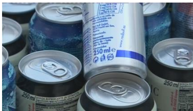
Latas de bebida