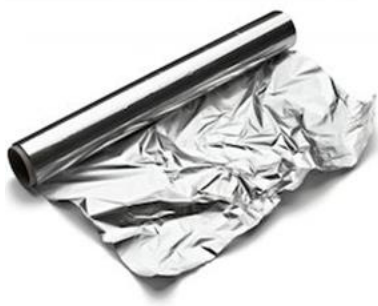
Papel de aluminio