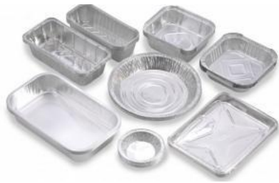
Bandejas para alimentos