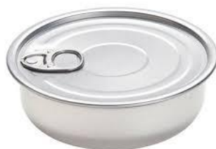
Latas de conservas