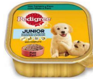
Comida para mascotas