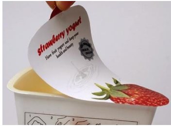
Tapas de yogur