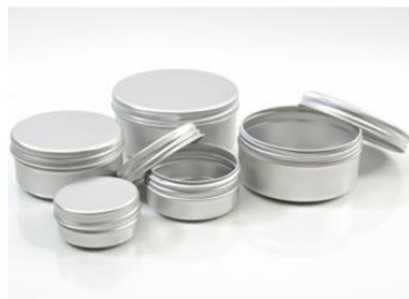
Tarros de cosmética