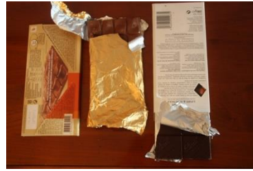
Envolturas para chocolate